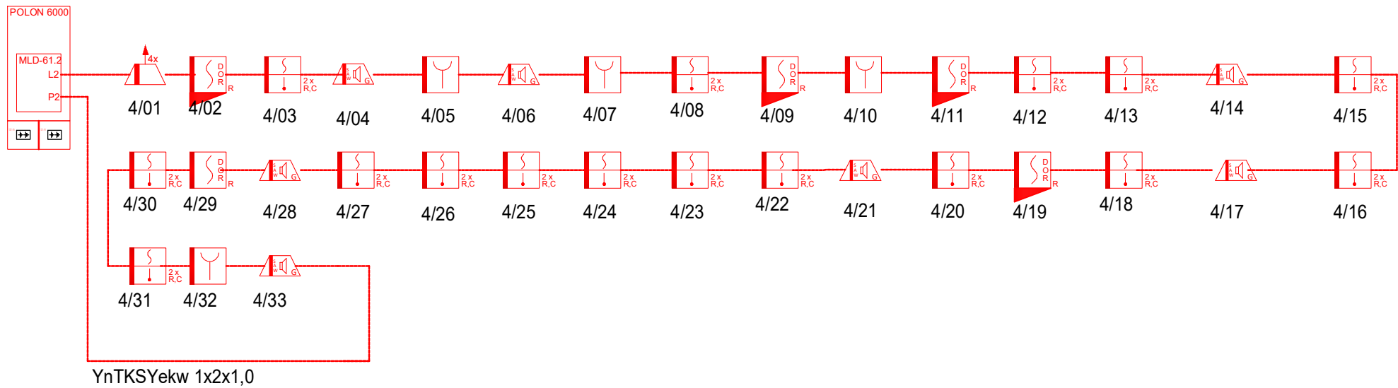
We. 1 - petla sali koncertowej